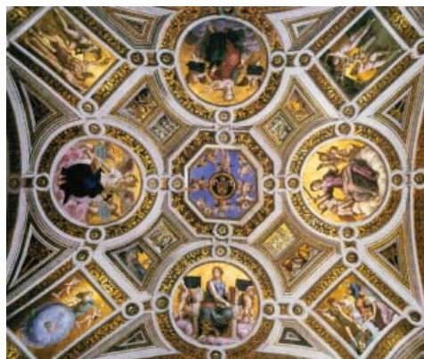
Pictura tavanului Stanzei della Segnatura

Rafael recuperează doar parțial picturile anterioare ale bolții, iar în cornișe realizează în frescă, în tondouri cu mozaic fals, personificările Teologiei , Jurisprudenței , Filosofiei și Poeziei .