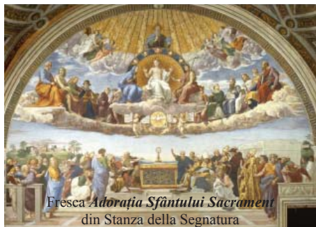
Fresca Adorația Sfântului Sacrament din Stanza della Segnatura

papirusul pe genunchi. În dreapta Sf. Augustin, mai în spate se află Sf. Toma de Aquino îmbrăcat în rasa neagră a benedictinilor și purtând aura tradițională a lui "Doctor Angelicus". Personajul următor, în picioare, cu tiară papală este Papa Inocențiu al III-lea, iar în rasă maronie cu o pălărie pe cap este Sf. Bonaventura. Urmează un alt papă cu tiară, Papa Sixt al IV-lea, iar lângă el este Dante cu cununa sa de laur. La picioarele papei Sixt al IV-lea și mai jos de scribul Sfântului Augustin se află cartea " De sanguine Cristi ", iar la picioarele Sfântului Augustin sunt două cărți închise și una deschisă așezată deasupra. Pe marginea unei cărți de la picioarele Sf. Augustin se poate descifra scris cu litere mari "DE • CI • DEI", prescurtarea titlului operei sale DE CIVITATE DEI, operă fără de care nu va putea fi niciodată înțeleasă istoria Evului Mediu Occidental Catolic. La picioarele Sfântului Ambrozie, episcop al orașului Milano se află de asemenea o carte, sugerând astfel importanța scrierilor sale dogmatice și a tratatelor de morală.