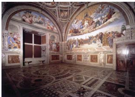
Vedere parțială a Stanzei della Segnatura (continuare în pag. 14)

Nimic nu este lăsat la voia întâmplării. Poziția Spiritului Sfânt sugerează eventual partea din Crez "... care de la Tatăl și de la Fiul purcede... ". Plasarea Tatălui în partea cea mai de sus a grupului celest, poate sugera faptul că Fiul este singura cale pe care se poate ajunge la Tatăl. Sunt atâtea simboluri încriptate în compoziție încât mulți autori consideră că Rafael a consultat un teolog în faza de concepție a frescei. Rafael a studiat scena printr-un număr însemnat de desene care se păstrează parțial în muzeele din Windsor, Oxford, Chantilly și altele. Cei care au studiat desenele au putut recunoaște influențe de-ale lui Leonardo, Fra Bartolomeo și Michelangelo [2]. Vasari povestește că Bramante, care era rudă îndepărtată cu Rafael, i-a facilitat lui Rafael, fără acordul lui Michelangelo, să vadă pe parcursul realizării frescele tavanului Sixtinei. Influența exercitată de Michelangelo este vizibilă în toate frescele executate de Rafael în cele patru camere încredințate de Papa Iuliu al II-lea pentru decorare.