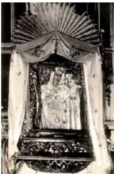
Fotografie de epocă (înainte de 1948) a icoanei făcătoare de minuni a Maicii Dom- nului de la Bixad