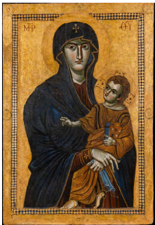
Icoana „Salus Populi Romani” din Bazilica „Santa Maria Maggiore” de la Roma

Dacă Papa Francisc a ales să fie înmormântat în Bazilica „Santa Maria Maggiore” (Sfânta Maria cea Mare) din Roma, aproape de icoana Maicii Domnului „Salus Populi Romani” (Protectoarea poporului roman), pe care a îndrăgit-o în chip deosebit, în România există o replică celebră a acelei icoane, la Mănăstirea Bixadului, din jud. Satu-Mare.