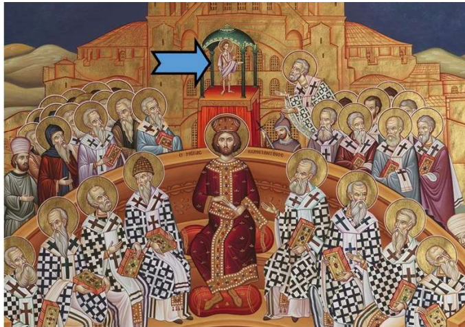
Icoană a Conciliului de la Niceea (325 dC), care a definit credința în dumnezeirea Fiului. Săgeata indică prezența statuii Pruncului Isus