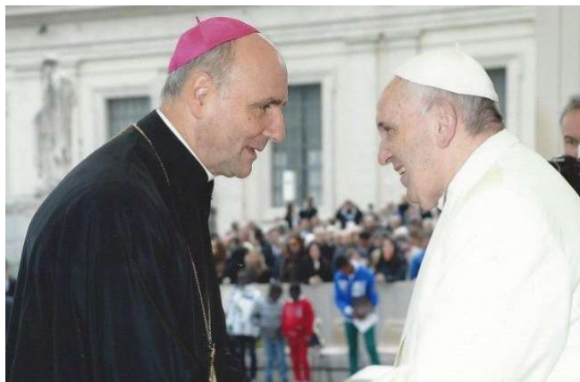
Episcopul Virgil Bercea și Papa Francisc

Tot la fel celelalte sacramente, am făcut cateheză cu copiii, am făcut botezuri, cununii prin case, că altfel nu se putea. Cel mai greu era luni dimineața când mergeam la lucru și trebuia să semnez condica – suflul îmi era plin de teamă și preocupat – oare mai pot intra la serviciu? După câteva ore mă linișteam. Nu a fost simplu dar a fost o muncă foarte frumoasă, iar credincioșii niciodată nu m-au trădat la securitate. »