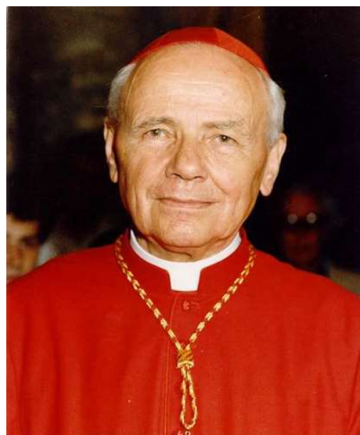
Cardinalul Alexandru Todea