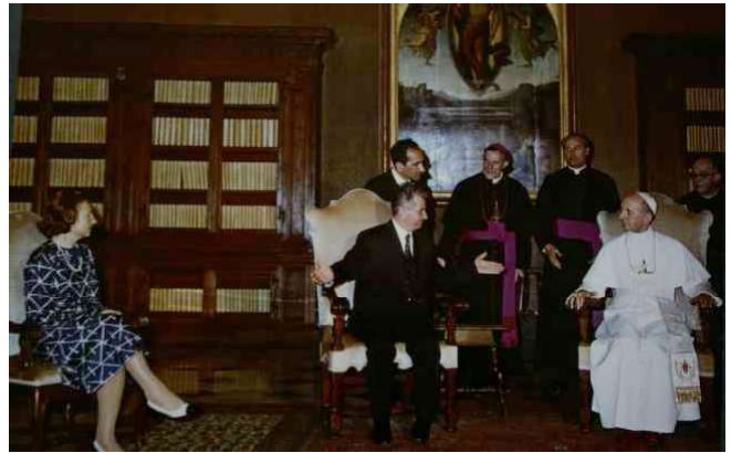
Ceaușescu, primit la Vatican de Papa Paul al VI-lea

«Da, atunci terminam armata la TR și în toamnă începeam facultatea la Cluj. Preasfințitul Todea mi-a arătat o poză în care erau Papa Paul al VI-lea cu Nicolae Ceaușescu. Acea poză a rămas tot timpul înrămată pe perete la intrare acasă la Reghin la Preasfințitul Todea, iar dânsul de fiecare dată când veneau de la securitate le arăta poza.