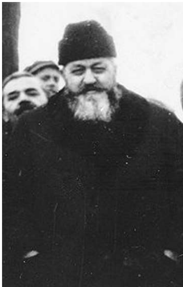
Fotografia Episcopului Valeriu Traian Frențiu de la dosarul său de securitate