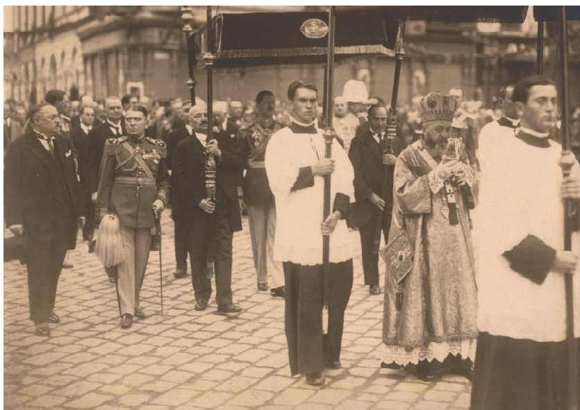
PSS Frențiu și Caro al II-lea , procesiune în Oradea