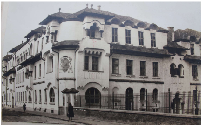
Școala Normală din Oradea