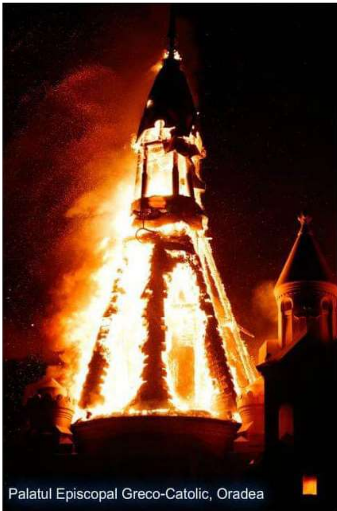
Palatul Episcopal Greco-Catolic, Oradea