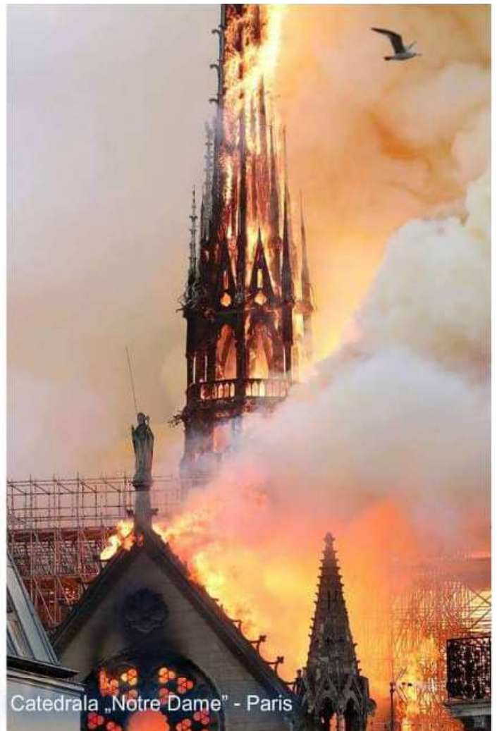
Catedrala „Notre Dame” - Paris

Excelența Voastră Monsenior Michel Aupetit, Arhiepiscop de Paris,