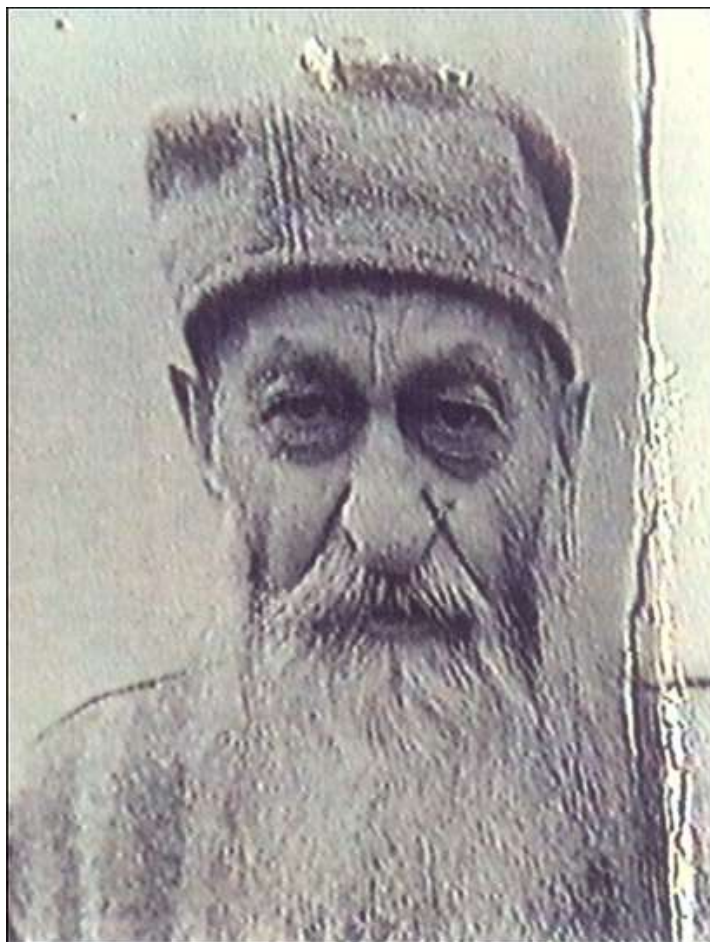
Fotografia Episcopului Valeriu Traian Frențiu de la dosarul său de securitate

În ultimele sale luni din viață, Episcopul Frențiu nu a mai putut coborî singur în curte, fiind ajutat de canonicul Tămăian. Apoi datorită faptului că i se umflau picioarele și mâinile, nu a mai ieșit din celulă, fiind asistat zilnic de canonicul Tămăian, care îl ajuta să se spele și să se îmbrace. Simțind apropierea sfârșitului, în luna iunie a anului 1952 i-a spus episcopului Iuliu Hossu că dacă nu se eliberează până la sfârșitul lunii