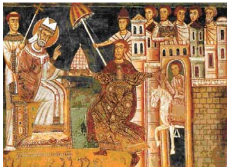
Frescă din sec. XIII Biserica Santi Quatro Coronati, Roma Papa Silvestru (stânga) primind donația de la Constantin (dreapta).

* Anul 824 Ludovic I cel Pios, fiul lui Charlemagne, impune Statelor Pontificale Constitutio Romana care le supune autorității imperiale. Papa mai beneficiază de puterea executivă, dar împăratul poate interveni oricând în afacerile Statelor Pontificale și mai ales în timpul alegerilor pontificale. Începe astfel un lung conflict dintre