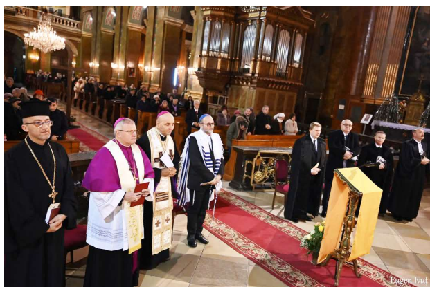
Prima zi - Catedrala Romano Catolică