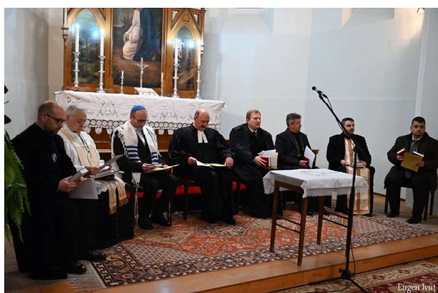
A patra zi - Biserica Evanghelică-Luterană