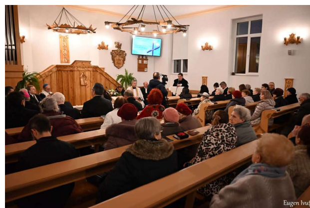
A șaptea zi - Biserica Reformată