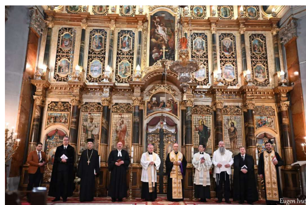
A opta zi - Biserica Greco-Catolică