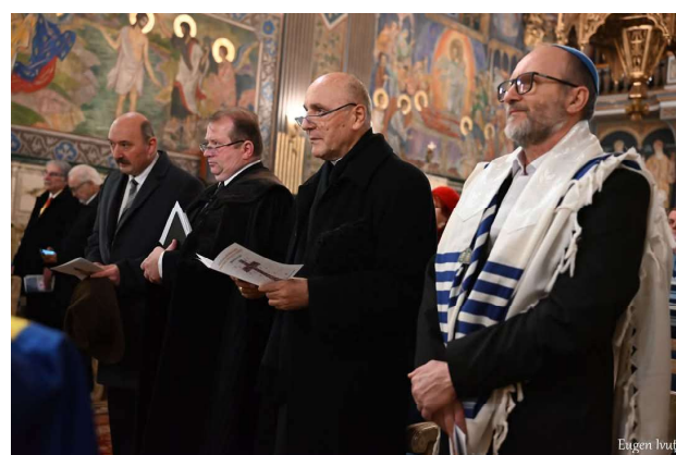
A șasea zi - Biserica Ortodoxă