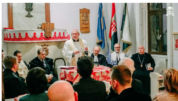
A doua zi - Biserica Unitariană