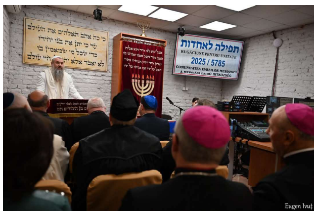
A treia zi - Sinagoga Evreilor Mesianici