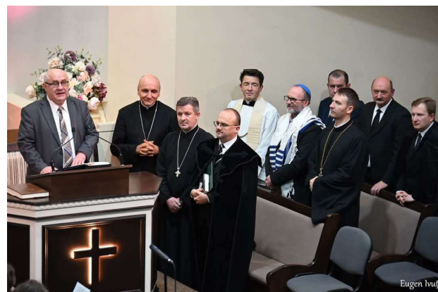
A cincea zi - Biserica Penticostală Tabor